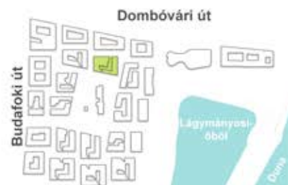
E épület / Building E