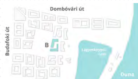
B épület / Building B